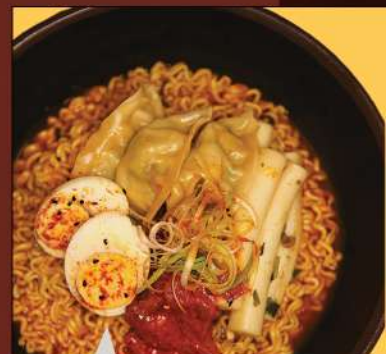
TTEOK MANDU RAMEN RÝŽOVÉ KOLÁČKY + MANDU + KIMCHI