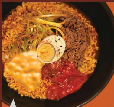
HOVĚZÍ RAMEN HOVĚZÍ MASO + KIMCHI + SÝR

Nevíte, co si vybrat? Vyzkoušej doporučené kombinace Pocha!